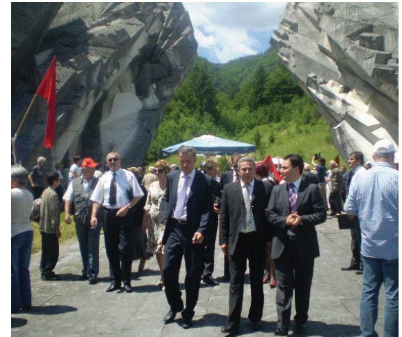
Централно обиљежавање овог догађаја реализовано је 13. јуна 2009. године на централном споменику погинулим борцима на Тјентишту

Намјера осовинских снага је била опколити и уништити главнину партизанских јединица на граници данашње БиХ и Црне Горе. Иако су партизанске снаге биле опкољене и претрпјеле огромне губитке, успјеле су се пробити из њемачког обруча те сачувати своју борбену способност, што је неколико мјесеци касније, након капитулације Италије, имало важне посљедице не само на будући ток рата него и на политичку будућност ових простора. Ова војна операцију се назива и "Пета непријатељска офанзива".