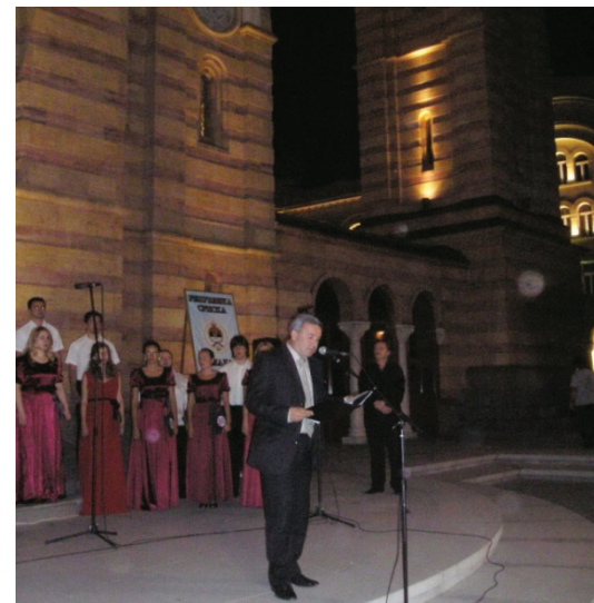
Прогон Срба из Републике Српске Крајине обиљежен је 3-4. августа у Бањалуци

Протјеривањем Срба из Републике Српске Крајине у операцији хрватске војске "Олуја", која је започела 4. августа 1995. године, Хрватска је починила злочин најмасовнијег етничког чишћења на простору бивше Југославије у ратовима деведесетих година прошлог вијека. У овој злочиначкој акцији хрватске војске убијена су и нестала 1.934 лица, од чега 1.196 цивила. Овом приликом протјерано је око 220.000 Срба из ових крајева.