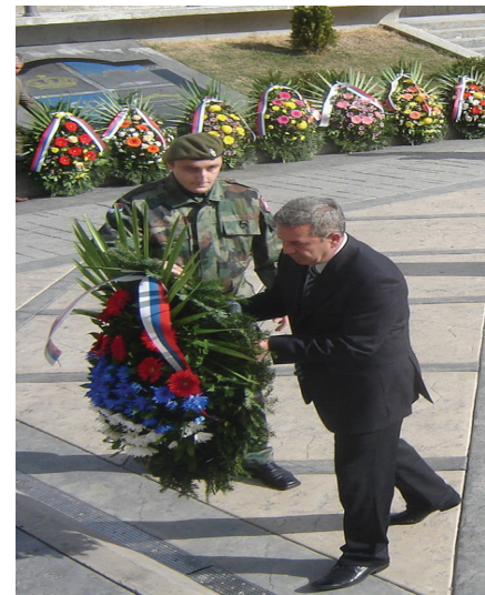
Обиљежавање овог догађаја реализовано је 10. октобра 2009. године полагањем цвијећа на Централном спомен обиљежју у Мркоњић Граду

У нападу на тринаест општина западне крајине, Хрватска војска и Армија БиХ починиле су масовне злочине над српским борцима и цивилима, те спалили и разрушили многа села и градове. Само у Мркоњић Граду откривена је масовна гробница у коју је бачено 181 лице, а слично је било и у другим западнокрајишким општинама.