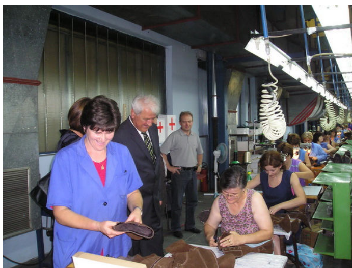
Обилазак производног програма „БЕМА“ у Бањалуци, корисника средстава по Пројекту суфинансирања запошљавања незапослених лица у 2008. години (демобилисани борци ВРС и лица која немају запослених чланова у домаћинства)

За пројекат запошљавања демобилисаних бораца и незапослених лица из вишечланих породица омогућено запошљавање 3.016 лица, а утрошено 6.032.000,00 КМ;