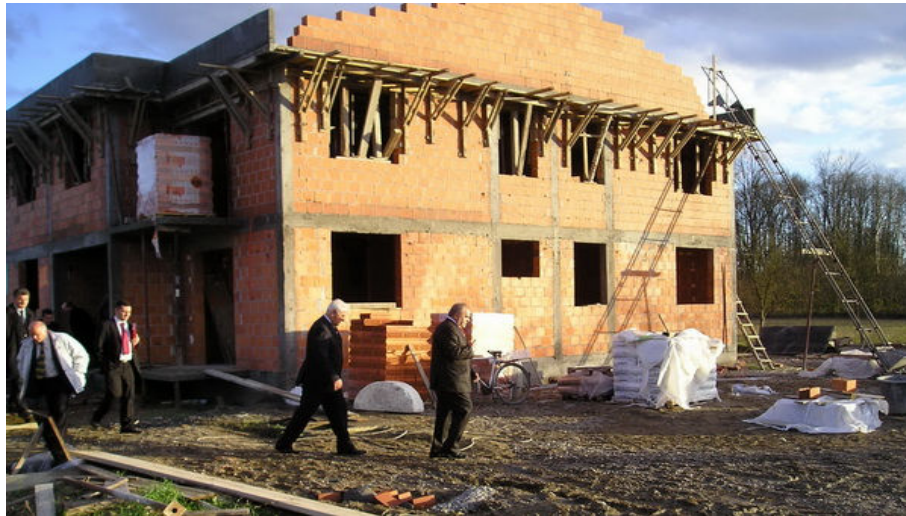
Обилазак објекта за изградњу ППБ и РВИ од I-IV категорије у Српцу

За реализацију овог Програма из буџета РС издвојена су средства у износу од 4.970,000,00 КМ а из развојног програма Републике Српске средства у износу од 7.000.000,00 КМ.