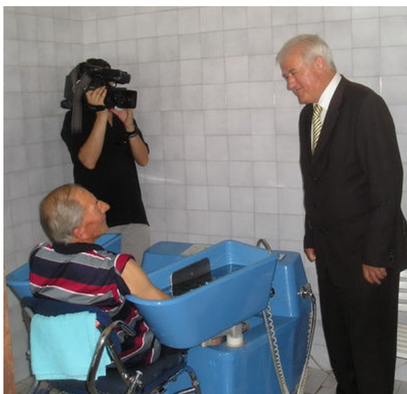
Обилазак ППБ и РВИ који се налазе у рехабилитацији у Бањи „Дворови“, Бијељина

За реализацију овог пројекта у 2008. години на име бањске рехабилитације ратних војних инвалида и чланова породица погинулих бораца, који су реахабилитацију провели у бањама Републике Српске, издвојена су средства у износу од 319.302,00КМ. Пројектом је планирано 700 корисника, а од наведеног броја бањску рехабилитацију је користило 687 корисника.