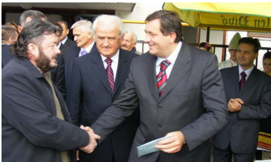
Премијер Додик уручује кључеве станова породицама ППБ и РВИ од I-IV категорије у Вишеграду

За реализацију овог Програма из буџета РС издвојена су средства у износу од 4.970,000,00 КМ а из развојног програма Републике Српске средства у износу од 7.000.000,00 КМ.