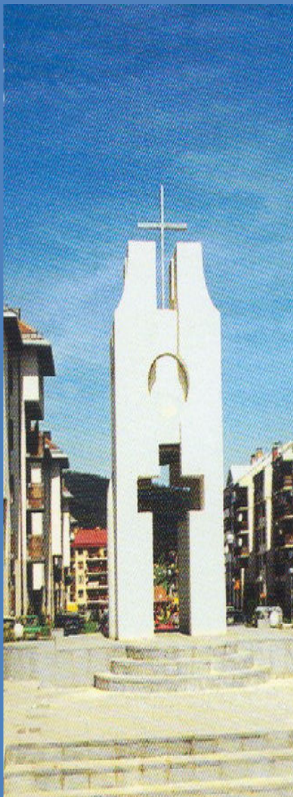
Споменик погинулим борцима ВРС у Палама

У 2008. години, за обиљежавање догађаја утврђених Програмом обиљежавања значајних историјских догађаја и догађаја везаних за знамените личности из ослободилачких ратова, издвојена су средства у износу од 219.389,00 КМ.