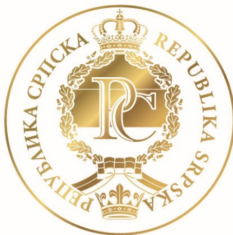
Симулација реализованог отиска