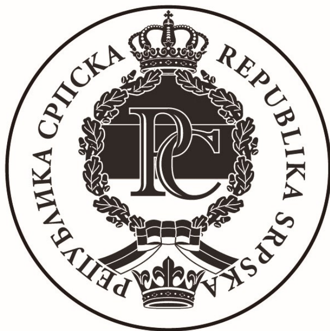
Клише за златотиск

Стилизација Амблема Републике Српске за намену отискивања у златној или сребрној фолији на папирној, кожној или платненој површини