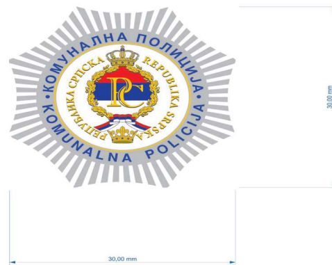
Прилог број 4.