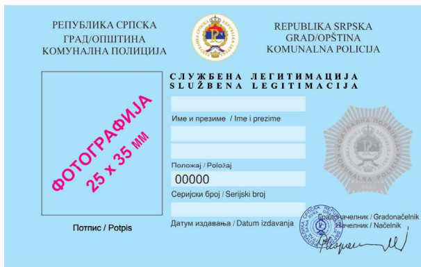
Прилог број 2.