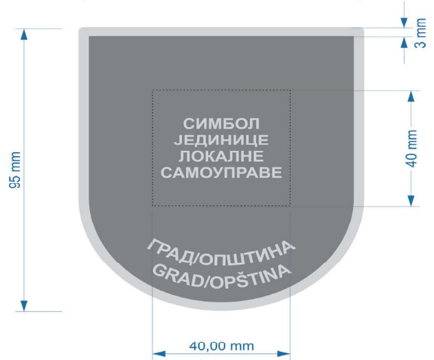
Прилог број 5.