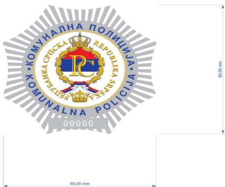
Прилог број 3.